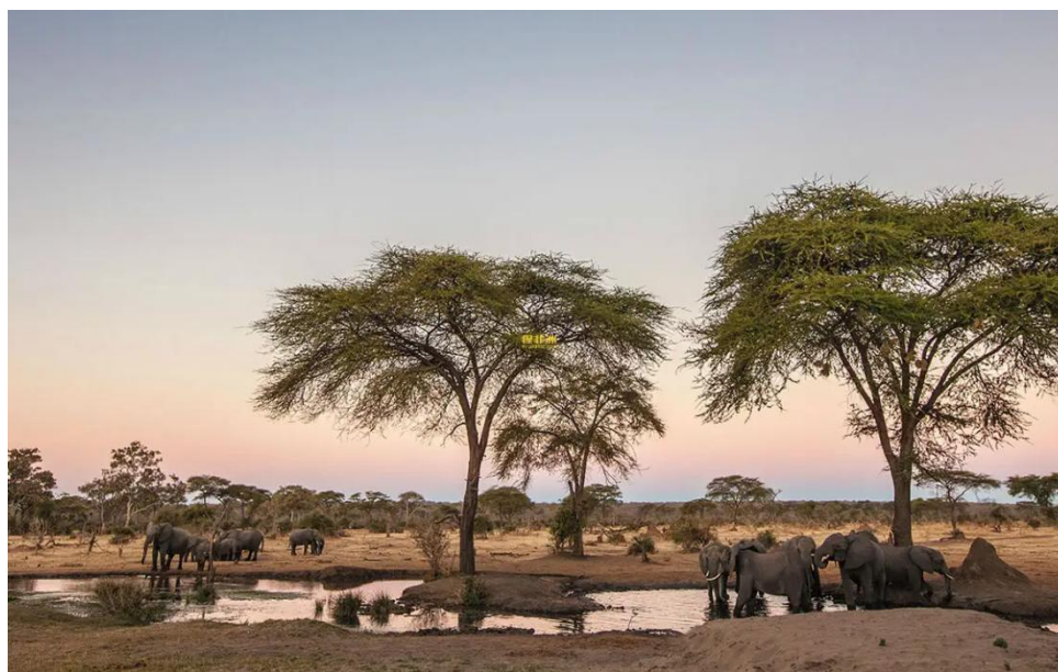
图 3 博茨瓦纳风景

据博茨瓦纳统计局数据，2020 年博茨瓦纳三大产业占 GDP 的比重分别为：农业 2.1%、工业 23.7%、服务业和其他 72.1%。对 GDP 贡献较大的行业主要为采矿业、建筑业、贸易、住宿及餐饮业及金融与商业服务等。博茨瓦纳农业涵盖种植业和畜牧业，从业人口占全国总人口的 60% 以上。农业曾是博茨瓦纳的主导产业，1966 年独立之初，农业占国民经济的比重为 42.7%。此后随着钻石经济的发展，农业在国民经济中的地位不断下降，2020 年其产值仅占 GDP 的 2.1%。钻石产业是博茨瓦纳经济的支柱产业，也是博茨瓦纳政府收入和外汇收入的重要来源。博茨瓦纳是非洲主要旅游国之一，旅游资源丰富，是非洲野生动物种类和数量较多的国家。