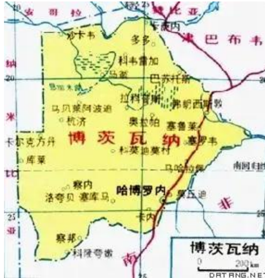
图 1 博茨瓦纳地图

博茨瓦纳是位于南部非洲高原中部卡拉哈里盆地的内陆国家。东部和东北部与津巴布韦相连，南部和东南部与南非接壤，西部和西北部与纳米比亚毗邻，东北与赞比亚交界。总面积 600,370 平方公里，其中陆地面积为 585,370 平方公里，水域面积 15,000 平方公里。平均海拔 1000 米左右，地势东高西低，境内无大的河流。博茨瓦纳矿产资源较为丰富。主要矿产资源有：钻石、铜镍、煤、苏打灰、铂、金、锰等。